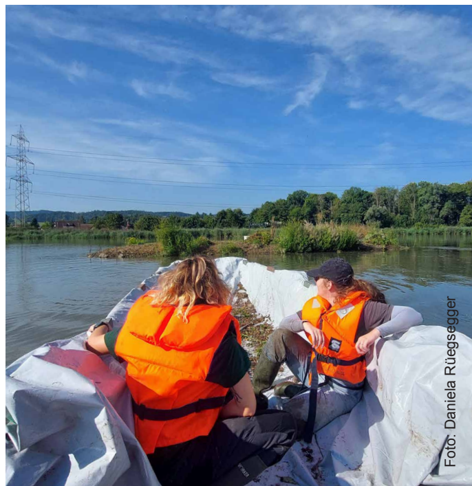
Das Unterhaltsteam wurde mit einem Boot vom Aarekraftwerk Klingnau zur Kiesinsel gebracht.

Um die meisten Pflanzen noch vor dem Versamen zu entfernen, fand der Pflegeeinsatz in diesem Jahr bereits im August statt. Auf der Kiesinsel wurde die gesamte Vegetation inklusive Wurzeln ausgerissen, damit dieser seltene, vegetationsarme Rast- und Brutplatz für Vögel mitten im Stausee erhalten bleibt. Das Aarekraftwerk Klingnau unterstützte den Einsatz durch den Transport des Teams sowie die Abfuhr des Schnittguts.