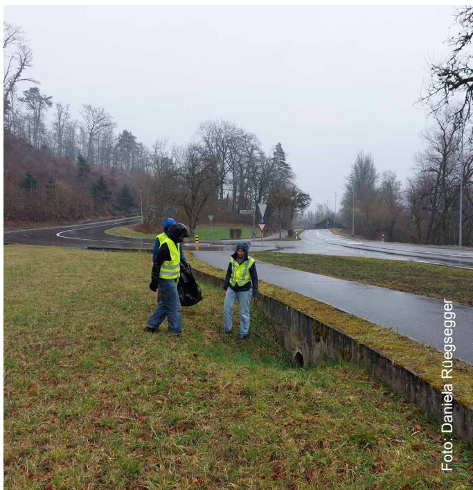
Das Amphibienleitsystem in Felsenau-Gippingen wird auf seine Funktionstüchtigkeit geprüft.

Die Amphibienleitsysteme Eien-Kleindöttingen und Felsenau-Gippingen wurden mehrfach auf ihre Funktionstüchtigkeit geprüft. Dies erfolgte sowohl zu Beginn als auch während der Wanderzeit bei der Hin- und Rückwanderung. Kleine Mängel wurden vom Team oder dem zuständigen Tiefbauamt behoben. Das Leitsystem in Eien-Kleindöttingen wurde jedoch nur für die Wanderung ins Laichgebiet konzipiert und nicht für die Rückwanderung ins Winterquartier. Während der Rückwanderung wurde dieser Ort und die Umgebung mehrmals kontrolliert, um zu prüfen, ob das Leitsystem ausgebaut werden sollte. Da aber nur einzelne tote